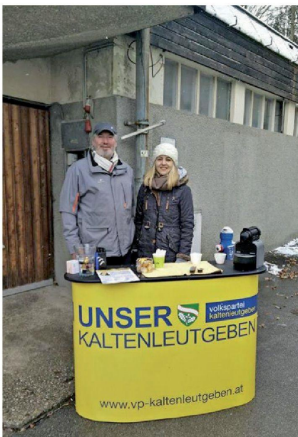
Oben: Neujahrsempfang am 22.1.2016 Links unten: Kaffeestand im Jänner Mitte unten: Kaffee und Primelverteilen Rechts unten: Faschingskrapfenverteilen