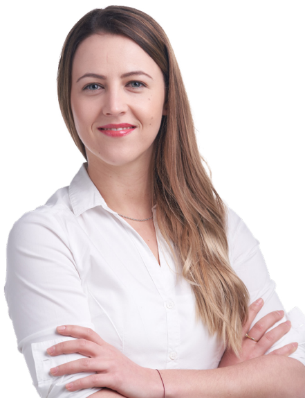
Bernadette Schöny Bürgermeisterin

Dazu wurde zwischen den Koalitionsparteien eine umfangreiche Vereinbarung beschlossen. Die Grundlage dafür war der gemeinsame Wunsch, die politische Verantwortung zum Wohle der Marktgemeinde Kaltenleutgeben zu übernehmen und die Zukunft des Ortes in wechselseitigen Respekt und Wertschätzung zu gestalten.